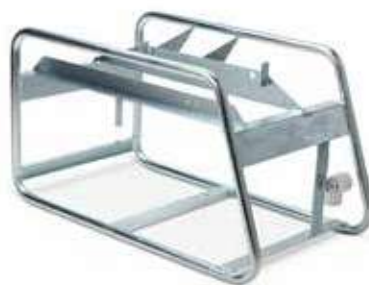
Rohrgestell (14 kg)