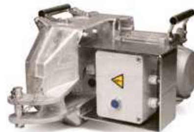
Schutzbügel zu Steuerkasten (3,4 kg)