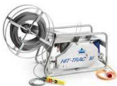
HIT-TRAC 16E komplett mit Rohrgestell und Haspelantrieb, ohne Seil (83 kg)