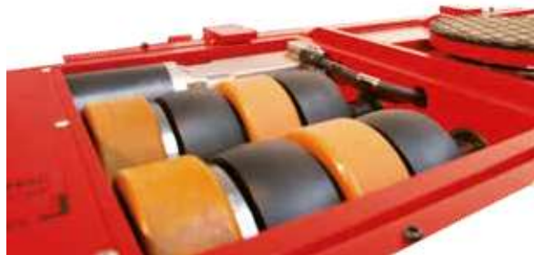
Kombination aus JUWathan®- und JUWamid-Rollen für optimale Traktion und Lenkeigenschaften