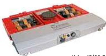
JLA-e 15/30 G