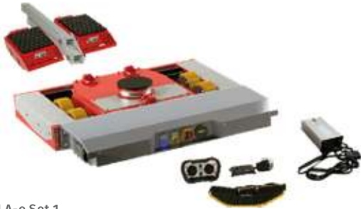
JLA-e Set 1