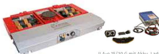
JLA-e 15/30 G mit Akku, Ladegerät, handliche Funkfernsteuerung und Gürtel mit Halterung!