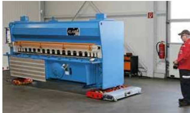
bis zu 30t spielend einfach bewegen