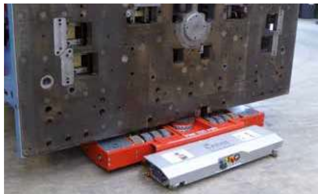
JLA-e 25/50 H in Aktion