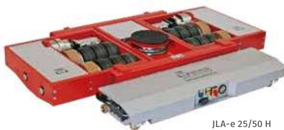
JLA-e 25/50 H