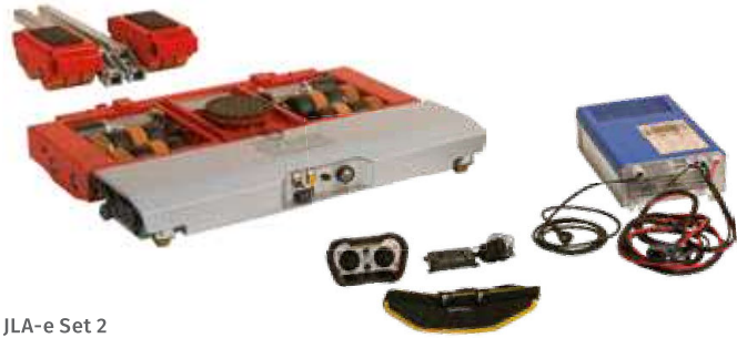
JLA-e Set 2