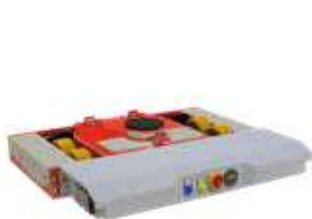
JLA-e 5/12 G