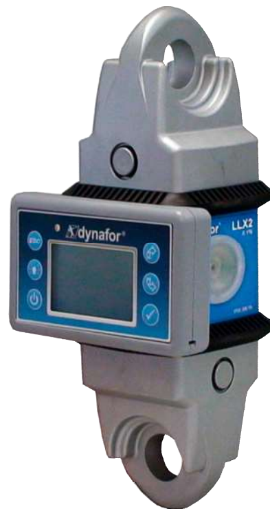
dynafor™ LLX2 0,5 t

Elektronisches Zugkraftmessgerät mit abnehmbarem und vernetzbarem Bedienteil und USB-port. Der dynafor™ LLX2 / LLXh ist ein Meilenstein in der Zugkraftmessung: Das Bedienteil kann am Messgerät angedockt oder abgenommen werden, um es als Fernablesegerät einzusetzen. Die einzelnen Messgeräte können miteinander vernetzt werden, sodaß z.B. drei Messwerte von drei Messgeräten auf einem Bedienteil angezeigt werden können. Die patentierten Anschlagösen der dynafor™ LLX2 erlauben die Verbindung sowohl mit handelsüblichen Schäkeln als auch mit allen genormten Kettenanschlagmitteln. Der dynafor™ LLX2 ist auch mit parallelen Anschlagösen (koplanar) lieferbar. Der dynafor™ LLXh wird mit parallelen Anschlagösen (koplanar) geliefert.