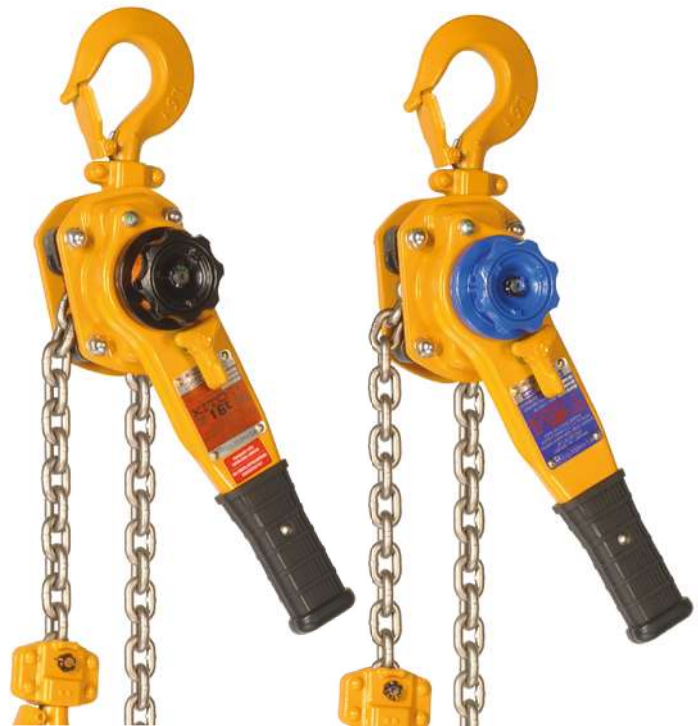
LB OLL mit Überlastschutz

Sicherheitsvorrichtung vor unbeabsichtigtem Freilauf unter Last.